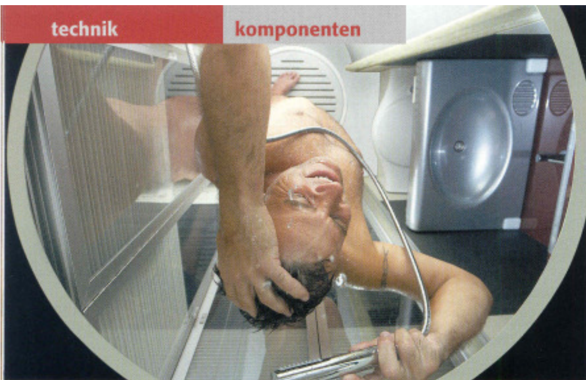
Blick von oben in die integrierte Duschkabine des Mo.T.I.S.-Fahrerhauses