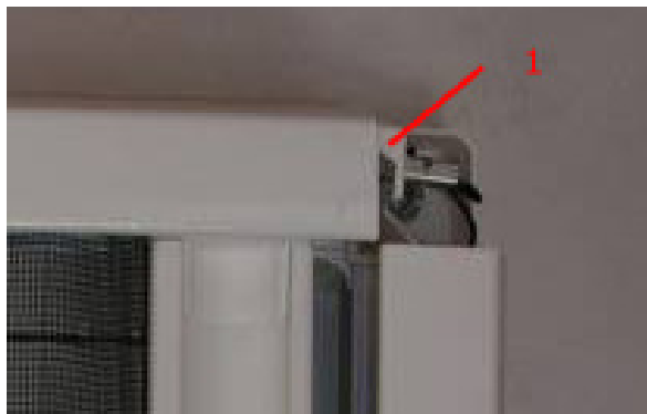
Bild 2 Ansicht unten